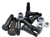
87980100 Messerkopf- Schrauben-Set